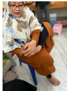
Gambar 6. Gerakan inti

Penyuluhan terkait gangguan aktivitas sehari-hari dapat dilakukan secara mandiri di rumah maupun ditempat kerja. Latihan yang diberikan sudah sesuai