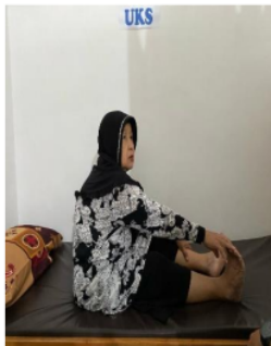
Gambar 5. Penatalaksanaan ADL Mandiri