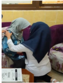
Gambar 3. Penanganan Keluhan