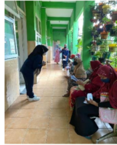
Gambar 2. Sesi Tanya Jawab