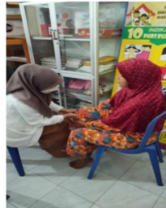
Gambar 4. Penatalaksanaan latihan stretching