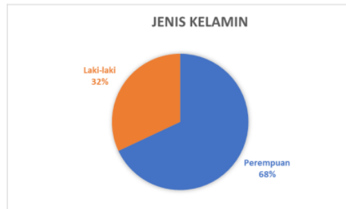
Diagram 1. Analisis Univariat

Berdasarkan diagram 1. diatas terkait penyuluhan gangguan aktivitas sehari-hari yang didasarkan definisi, penyebab, tanda gejala, pencegahan, dan terapi latihan rata-rata para lansia yang memiliki keluhan dirasakan paling banyak adalah perempuan dengan 68% (17 orang) dan laki-laki 32% (8 orang). Hal ini sudah masuk di dalam data quisioner pada saat pengisian keluhan.