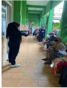
13 Gambar 1. Penyampaian Materi