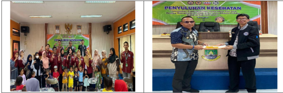
Gambar 1. Foto Kegiatan Penyuluhan Kesehatan

Dari kegiatan penyuluhan tersebut terlihat antusiasme peserta yang berasal dari anak Balita yang didampingi oleh ibu-ibu serta ibu hamil terkait pengetahuan inovasi makanan bergizi yang berasal dari daun kelor tersebut.