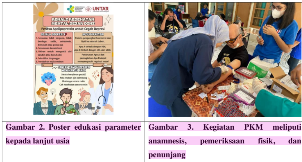
Gambar 2. Poster edukasi parameter kepada lanjut usia