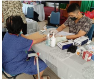
Gambar 1. Proses Kegiatan Pemeriksaan Darah

Pelaksanaan kegiatan deteksi dini ini ditujukan kepada populasi lansia di Panti Werda Hana, Tangerang Selatan yang mengikutsertakan 61 peserta. Alat yang digunakan dalam kegiatan ini berupa kuesioner dan alat pemeriksaan darah. Peserta mengikuti rangkaian kegiatan berupa pemeriksaan darah (Gambar 1). Interpretasi hasil pemeriksaan darah berupa kadar asam urat (Tabel 1) dilampirkan.