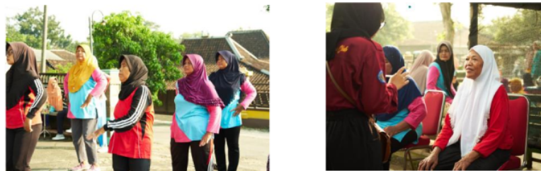
Gambar 4 Pendampingan kader melakukan latihan fisik

Dalam tahap ini, tim pengabdian memberikan edukasi kepada kader tentang beberapa latihan fisik yang aman dan dapat dilakukan oleh lansia, dilengkapi dengan hitungan pengulangan latihan (dijelaskan di metode).