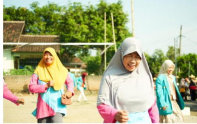
Gam bar 5 Pendampingan kader dalam melakukan tes 6MWT

Kegiatan ini kader melihat tim pengabdiann memperagakan cara melakukan tes 6MWT, kemudian kader berjalan untuk melakukan tes 6MWT