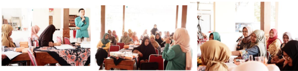
Gambar 2 Penyuluhan oleh tim dan tanya jawab

Penyuluhan (edukasi) tentang kebugaran dan kesehatan lansia di Posyandu lansia Melati, Bendosari, Sukoharjo dilakukan di hadapan 32 kader posyandu. Keberhasilan pemahaman dan peningkatan pengetahuan kader terhadap materi kebugaran dan kesehatan lansia dijelaskan dalam nilai pre-post test . Nilai pre test adalah nilai sebelum diberikan penyuluhan (edukasi), sedangkan nilai post-test adalah nilai setelah diberikan penyuluhan (edukasi). Penyuluhan kepada kader ditampilkan dalam gambar 2.