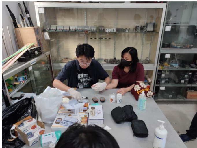
Gambar 2 Pelaksanaan Pemeriksaan Asam Urat

Faktor risiko kadar asam urat dapat dikategorikan ke dalam beberapa kategori utama. Pola makan tinggi purin merupakan salah satu faktor risiko utama. 6 Konsumsi makanan yang kaya akan purin seperti daging merah, makanan laut, dan minuman beralkohol, terutama bir