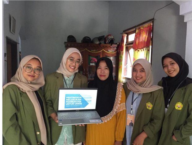
Gambar 3 Foto bersama usai pemaparan materi dan praktek bersama

Dalam program pendampingan ini, penulis membantu mitra menguasai aplikasi Catatan Keuangan untuk laporan keuangan dan akuntansinya. Pendampingan penggunaan aplikasi catatan keuangan meliputi penginstalan aplikasi dan pencatatan transaksi. Penulis mendapat tanggapan yang positif dari kedua mitra, terbukti kedua mitra berperan aktif dalam kegiatan pelatihan dan pendampingan ini. Kedua mitra juga antusias dengan penyampaian materi dan demonstrasi/latihan yang ada.