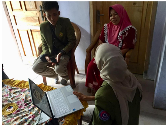
Gambar 1 Pemaparan materi kepada mitra UMKM

Pelatihan pembuatan laporan keuangan buku kas berbasis digital diselenggarakan bersama mitra Cemal – Cemil By Dian dan Finza Cake & Cookies di Desa Mranggonlawang Kabupaten Probolinggo. Penulis memilih mitra tersebut karena dua UMKM tersebut memiliki motivasi dan kemauan untuk meningkatkan kualitas usahanya. Mengingat kondisi di pedesaan sulit untuk diberikan arahan menggunakan teknologi apabila tidak dari hati nuraninya. Pendampingan dimulai dengan memberikan pemaparan materi mengenai pengertian dan manfaat penyusunan laporan keuangan. Hal ini juga bertujuan untuk memotivasi para pelaku UMKM tersebut untuk lebih memahami pentingnya membuat laporan keuangan secara digital.