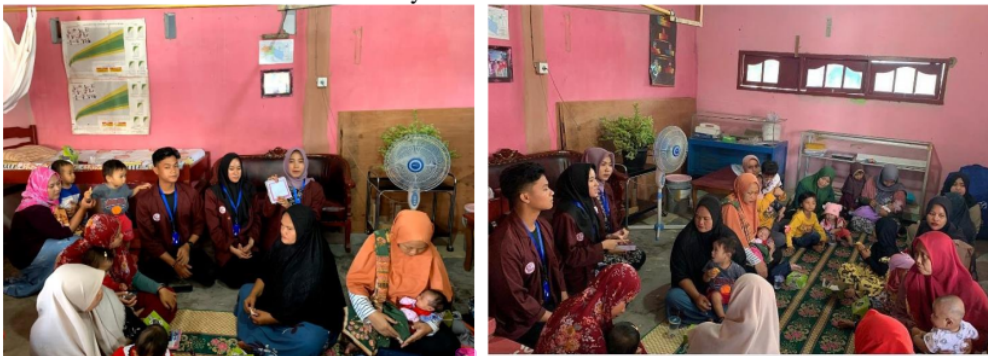
Gambar 3. Penyuluhan dan diskusi

Setelah penyuluhan, dilakukan uji pemahaman ibu-ibu peserta penyuluhan terhadap tanda, gejala serta dampak stunting pada anak serta upaya-upaya apa yang dapat dilakukan untuk pencegahan kejadian stunting dengan cara memberi pertanyaan berupa kuis kepada peserta dan meminta peserta mengulang kembali materi yang telah diberikan selama penyuluhan. Kuis yang diberikan berupa 10 pertanyaan seputar pengetahuan dan sikap peserta dalam persiapan menghadapi menopause. Dari 10 pertanyaan yang diajukan oleh