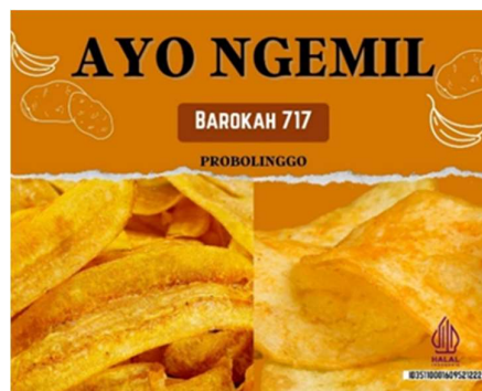
Gambar 2. Desain Logo Produk

Logo produk merupakan salah satu hal yang penting dalam suatu produk bisnis karena sebagai identitas produk agar dapat diingat maupun dikenali oleh calon konsumen. Penambahan desain logo produk diharapkan mampu menambah daya tarik calon konsumen keripik singkong dan keripik pisang. Dalam pembuatan logo produk sudah tercantum logo halal beserta ID halal sehingga calon konsumen tidak perlu meragukan lagi. Desain logo prooduk keripik pisang dan keripik singkong dapat dilihat pada Gambar 2 .