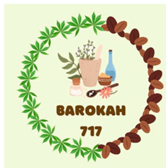
Gambar 7. Logo UMKM Barokah 717