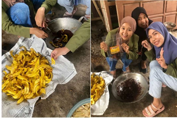
Gambar 4. Proses Pencampuran Pada Keripik Pisang