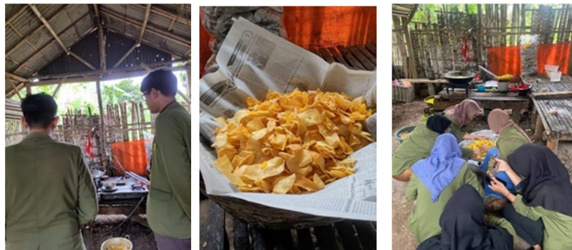
Gambar 3. Proses Pencampuran Pada Keripik Singkong

Setelah proses pencampuran selesai selanjutnya memasukkan keripik ke dalam kemasan standing pouch ukuran besar. Kemasan dapat dilihat pada Gambar 5 .