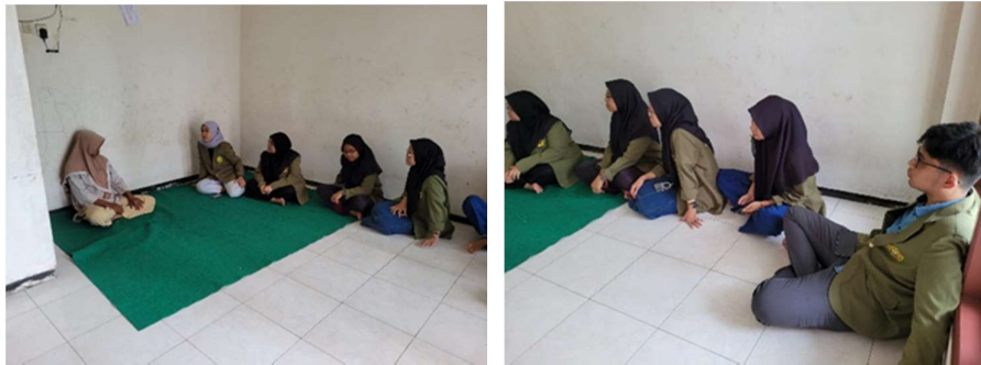
Gambar 1. Wawancara dengan pelaku UMKM Barokah 717

Peneliti melakukan survei lokasi dan juga mewawancarai pelaku usaha UMKM Barokah 717 terkait dengan produk baru berupa keripik pisang dan keripik singkong. Sehingga didapatkan kesimpulan permasalahan pengembangan produk keripik pisang dan keripik singkong tersebut. Dokumentasi wawancara dapat dilihat pada Gambar 1 .