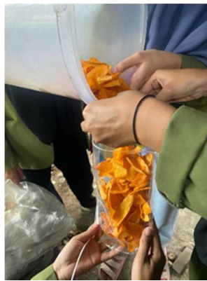
Gambar 5. Proses Memasukkan Keripik Kedalam Kemasan