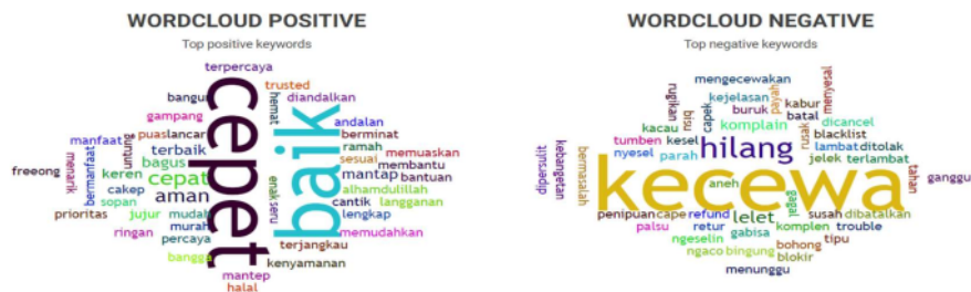
Gambar 4.2. Data Wordcloud Positive dan Wordcloud Negative Terhadap Anteraja pada Bulan Maret 2023 di Twitter.

Selain itu, juga terdapat wordcloud . Dimana wordcloud merupakan visualisasi dari kata-kata yang paling sering digunakan. Ukuran yang berbeda-beda pada setiap kata yang tertera menggambarkan seberapa seringnya kata tersebut muncul, disebut, atau dibahas.