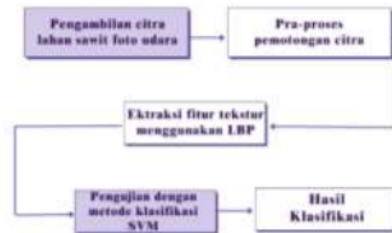
Gambar 1. Tahap penelitian

Tahap preprocessing melibatkan serangkaian proses yaitu pemotongan citra dan pengkonversian citra berwarna Red Green Blue (RGB) menjadi abu-abu. Dengan dimensi asli citra Foto Udara ini adalah 3008 x 1960 piksel ditunjukkan pada Gambar 2.