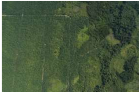
Gambar 2. Citra Foto Udara RGB

Tahap preprocessing melibatkan serangkaian proses yaitu pemotongan citra dan pengkonversian citra berwarna Red Green Blue (RGB) menjadi abu-abu. Dengan dimensi asli citra Foto Udara ini adalah 3008 x 1960 piksel ditunjukkan pada Gambar 2.