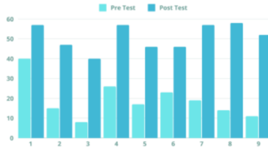
8 Gambar 6. Grafik hasil pre-test dan post-test

28 Hasil kuesioner post-test menunjukkan perubahan yang signifikan dibandingkan pre-test, yaitu pemahaman siswa terhadap pembuatan konten digital marketing khususnya melalui TikTok semakin meningkat. Peningkatan ini dimaksudkan untuk membantu siswa menggunakan kamera dan alat penerbitan video lainnya secara lebih efektif untuk membuat konten yang lebih menarik dan bernilai bagi komunitas luas. Pemahaman yang diperluas ini mencakup berbagai aspek teknis dan kreatif dalam pembuatan konten dan bertujuan untuk meningkatkan kualitas dan daya tarik konten yang dibuat siswa.