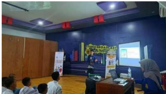
Gambar 4. Pemaparan materi oleh narasumber

Kegiatan selanjutnya adalah pemaparan materi berjudul “Menggali Potensi Kreativitas dalam Pengembangan Skill Videografi” yang tampak pada gambar 4. Materi ini dibawakan oleh pembicara undangan William Asella Putra, seorang videographer dan content creator . Isi materinya meliputi algoritma media sosial khususnya TikTok, tips pembuatan konten, strategi pemasaran, kesalahan umum saat membuat hook, contoh konten menarik, dan masih banyak lagi.