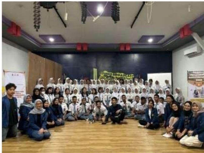
Gambar 7. Foto bersama tim pengabdian, pembicara, dan peserta.

28 Hasil kuesioner post-test menunjukkan perubahan yang signifikan dibandingkan pre-test, yaitu pemahaman siswa terhadap pembuatan konten digital marketing khususnya melalui TikTok semakin meningkat. Peningkatan ini dimaksudkan untuk membantu siswa menggunakan kamera dan alat penerbitan video lainnya secara lebih efektif untuk membuat konten yang lebih menarik dan bernilai bagi komunitas luas. Pemahaman yang diperluas ini mencakup berbagai aspek teknis dan kreatif dalam pembuatan konten dan bertujuan untuk meningkatkan kualitas dan daya tarik konten yang dibuat siswa.