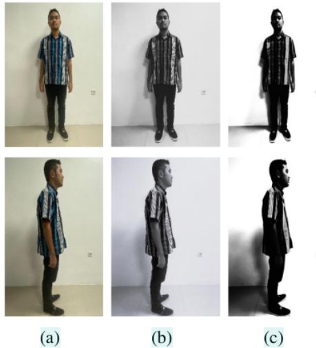
Gambar 3. Preprocessing (a) Citra Masukkan Akuisisi Awal (b) Konversi ke Format Grayscale (c) Konversi ke Format BW

ataupun menghadap kesamping, lalu citra tersebut diubah lagi ke dalam bentuk citra hitam putih untuk mempermudah membedakan bagian objek dan latar pada citra seperti pada gambar 3(c).