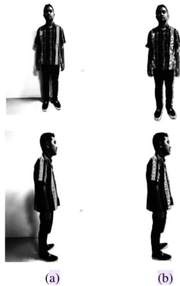
Gambar 4. Operasi Morfologi (a) Citra Hasil Dilasi dan Filling (b) Hasil Labeling Terhadap Objek