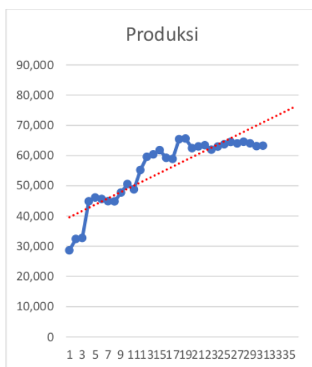
Gambar 1. Grafik perkembangan luas lahan tanaman aren dari tahun 1992 sampai dengan tahun 2022.