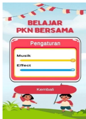
Gambar 4.5 Tampilan Pengaturan

Pada gambar diatas merupakan tampilan skor jika pemain telah menyelesaikan game, dalam tampilan skor terdapat tombol untuk mengulangi game dan tombol menu utama untuk kembali ke halaman utama.