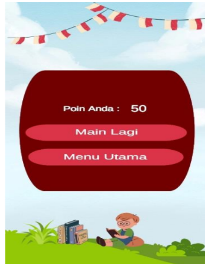
Gambar 4.4 Tampilan Skor

Pada gambar diatas merupakan tampilan skor jika pemain telah menyelesaikan game, dalam tampilan skor terdapat tombol untuk mengulangi game dan tombol menu utama untuk kembali ke halaman utama.