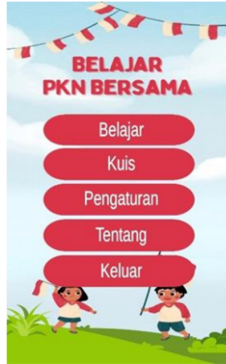
Gambar 4.1 Tampilan Utama

Berikut adalah beberapa tampilan hasil dari pembuatan game edukasi multimedia pembelajaran mata pelajaran PKN menggunakan Unity