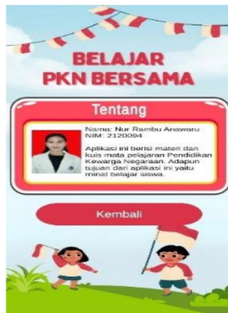
Gambar 4.6 Tampilan Menu Tentang

Gambar diatas merupakan tampilan informasi pengembang jika pemain memilih menu tentang, pada halaman informasi pengembang terdapat Nama, Nomor Induk Mahasiswa (NIM), dan penjelasan tentang isi aplikasi. Bila pengguna ingin kembali ke halaman utama maka diarahkan untuk memilih menu kembali.