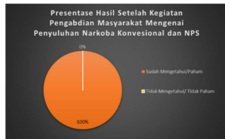
Gambar 2. Diagram Hasil Sesudah Kegiatan Pengabdian Masyarakat Mengenai Penyuluhan Narkoba Konvensional dan NPS

Adapun hasil akhir dari jawaban post-test yang ditunjukkan dalam diagram berikut ini diketahui bahwa semua 41 peserta sangat antusias dalam kegiatan ini, hal ini dikarenakan peserta 100% sudah mengetahui dan memahami tentang narkoba konvensional dan NPS.