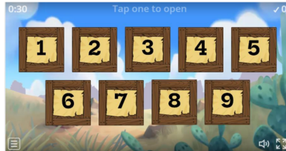
Gambar 2. Tampilan Wordwall Materi Jenis-Jenis Sudut