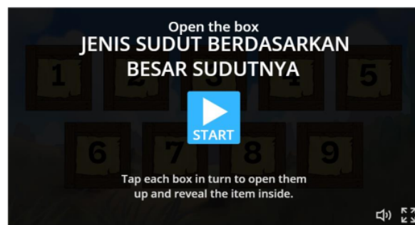
Gambar 1. Halaman awal media pembelajaran wordwall