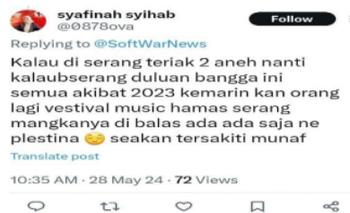
Gambar 3. Pro Israel

Selain dari pro palestina, Begitu pula sebaliknya ada yang menyalahkan beberapa pihak Palestina salah satu nya adalah Hamas, banyak yang menganggap dalang kekacauan konflik