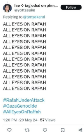
Gambar 1. Pro Palestina

Mencuatnya tagar "All Eyes On Rafah" yang tersebar melalui media sosial di laman X (Twitter), Mereka membuat hal tersebut sebagai awareness bahwa tindakan ini merupakan bentuk dukungan kepada Palestina dalam upaya pemberhentian serangan yang dilakukan oleh militant Israel yaitu IDF, Seperti yang kita tahu, tagar "All Eyes on Rafah" ramai digunakan akibat penyerangan Israel ke Palestina yang memakan korban jiwa. Korbang dari serangan Israel malam itu merupakan yang terparah pada tahun ini, tak hanya lansia ataupun orang