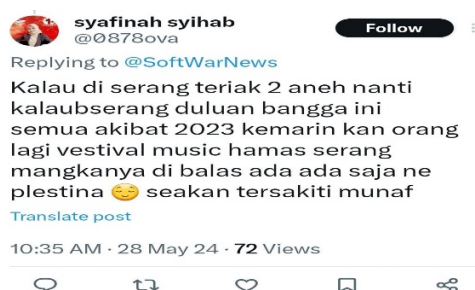
Gambar 3. Pro Israel

Selain dari pro palestina, Begitu pula sebaliknya ada yang menyalahkan beberapa pihak Palestina salah satu nya adalah Hamas, banyak yang menganggap dalang kekacauan konflik