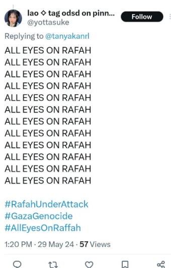
Gambar 1. Pro Palestina

Mencuatnya tagar “All Eyes On Rafah” yang tersebar melalui media sosial di laman X (Twitter), Mereka membuat hal tersebut sebagai awareness bahwa tindakan ini merupakan bentuk dukungan kepada Palestina dalam upaya pemberhentian serangan yang dilakukan oleh militant Israel yaitu IDF, Seperti yang kita tahu, tagar "All Eyes on Rafah" ramai digunakan akibat penyerangan Israel ke Palestina yang memakan korban jiwa. Korbang dari serangan Israel malam itu merupakan yang terparah pada tahun ini, tak hanya lansia ataupun orang