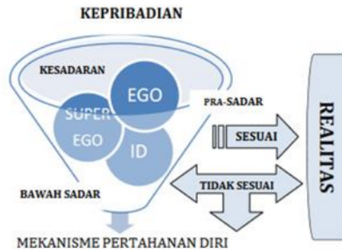
Gambar 4: Model relasi antara level dan struktur kepribadian, serta mekanisme pertahanan diri dengan realitas eksternal, (Diambil dari jurnal: STRUKTUR KEPERIBADIAN MANUSIA DALAM PSIKOANALISIS SIGMUND FREUD PERSPEKTIF FILSAFAT PENDIDIKAN ISLAM, tahun 2023 karya: Ishom Fuadi Fikri, Syarof Nursyah Ismail, Husniyatus, Salamah Zainiyati, Nur Kholis.)

Freud mengibaratkan kehidupan psikis atau kejiwaan manusia seperti gunung es (iceberg) yang terapung di lautan. Sedikit bagian yang terlihat di permukaan air merupakan alam sadar (consciousness), bagian yang jauh lebih besar berada di bawah permukaan air merupakan alam bawah sadar (unconsciousness). Sedangkan daerah yang menghubungkan antara alam sadar dan bawah sadar adalah alam pra-sadar (pre-consciousness);