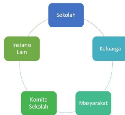
Gambar 2.0. Bagan Hubungan Institusional

Merupakan hubungan kerjasama antar sekolah dengan lembaga-l lembaga atau instansi-instansi resmi lain, baik swasta maupun pemerintah, seperti hubungan kerjasama antar sekolah dengan sekolah-sekolah lain, dengan kepala pemerintahan setempat, jawatan penerangan, jawatan pertanian, perikanan dan peternakan, dengan perusahaan-perusahaan negara maupun swasta, yang berkaitan dengan perbaikan dan perkembangan pendidikan pada umumnya. Sekolah sebagai lembaga pendidikan yang mendidik anak-anak yang nantinya akan hidup sebagai anggota masyarakat yang terdiri atas berbagai macam golongan, jabatan, status sosial, dan bermacam-macam pekerjaan, sangat memerlukan hubungan kerjasama itu. Berikut merupakan bagan dari hubungan Institusional: