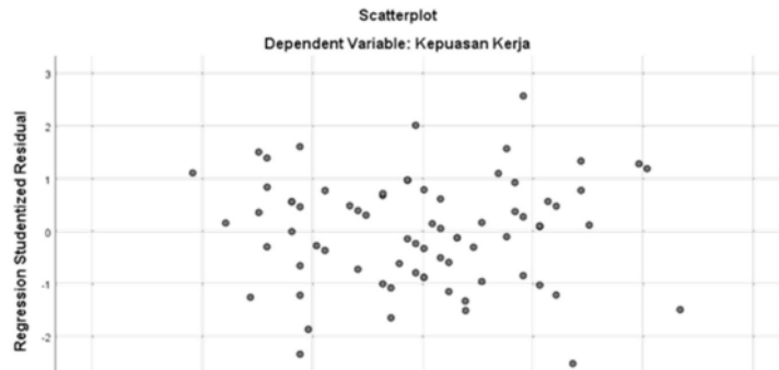
Gambar 2. Hasil Uji Heteroskedastisitas

Uji Heteroskedastisitas bertujuan untuk menguji apakah dalam model regresi terjadi ketidaksamaan varians. Adapun hasil uji heterokedasitas yang diperoleh dalam penelitian ini adalah sebagai berikut