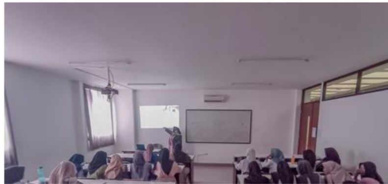
Gambar 2 Pembelajaran Konvensional

Pembelajaran diferensiasi pada mata kuliah bahasa Indonesia dengan materi proposal ilmiah diterapkan di kelas eksperimen. Kelas kontrol menerima materi dengan metode konvensional.