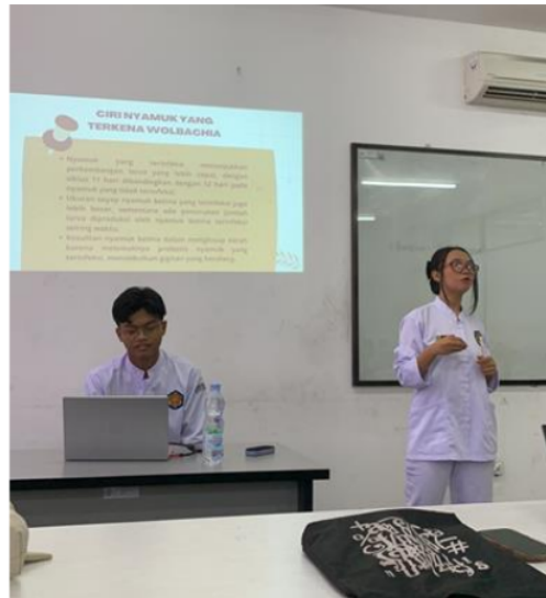
Gambar 5 Diferensiasi Produk

Perwakilan kelompok mempresentasikan tugas proposal ilmiah dengan menyajikan proposal dan power point. Setelah seluruh strategi diferensiasi selesai, mahasiswa mengikuti post-test. post-test diikuti oleh kelompok kontrol dan kelompok eksperimen.