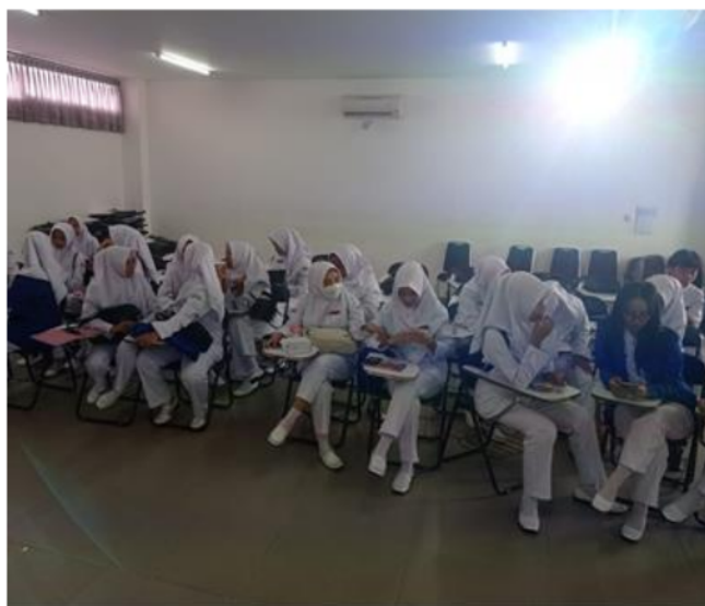
Gambar 4. Diferensiasi Proses

Diferensiasi proses dilakukan setelah pemberian konten oleh dosen. Diferensiasi proses melibatkan seluruh mahasiswa yang dibentuk kelompok. Setiap ketua kelompok memiliki tugas menjelaskan kembali materi proposal terhadap teman-teman mahasiswa yang belum menyerap materi sehingga memahami.