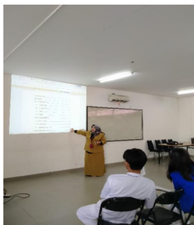
Gambar 3 Diferensiasi Konten

Diferensiasi proses dilakukan setelah pemberian konten oleh dosen. Diferensiasi proses melibatkan seluruh mahasiswa yang dibentuk kelompok. Setiap ketua kelompok memiliki tugas menjelaskan kembali materi proposal terhadap teman-teman mahasiswa yang belum menyerap materi sehingga memahami.